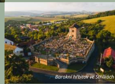
Barokní hřbitov ve Strlíkách