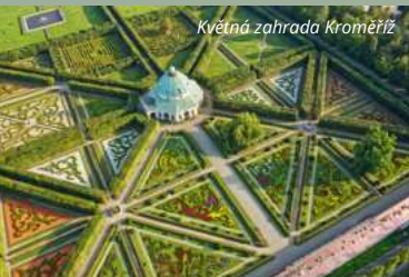
Květná zahrada Kroměříž

Muzeum Kroměřížska s Památníkem Maxe Švabinského.