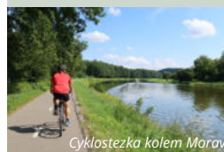
Cyklostezka kolem Moravy

Z centra Kroměříže vede skvělá cyklostezka kolem řeky Moravy k Baťovu kanálu. Kopcovitý terén čeká v Chříbech a v Hostýnských vrších.