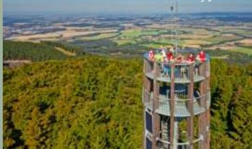
Rozhledna Kelčský Javorník