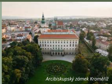
Arcibiskupský zámek Kroměříž

Arcibiskupský zámek s Podzámeckou zahradou.