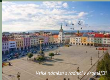
Velké náměstí s radnicí v Kroměříži

Holešov se zámekem a zahradou, židovské památky či kovárna.