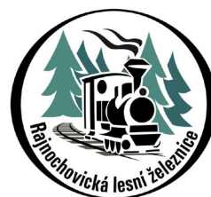
Foto: Rajnochovická lesní železnice